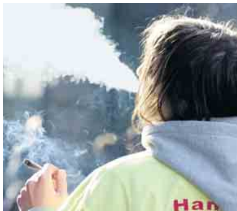
Negli ultimi anni hanno aumentato il principio attivo della cannabis dal 2 al 20%.

Gli effetti che la droga «leggera» provoca nel fumatore abituale e in quello occasionale mostrano un ampio elenco di danni, documentati e de-